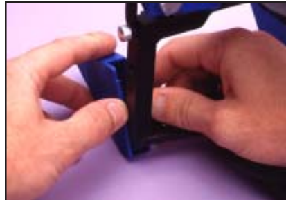
(4.) Empujar los ganchos lateralmente y hacia atrás para removerlos.