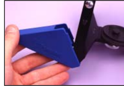
(1.) Color el extremo inferior de la pata de apoyo en la base del articulador.