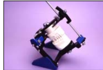
(5.) Las patas pueden apoyar el articulador 45° grados hacia atrás para consultas del paciente y para procedimientos fotográficos.