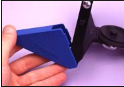
(1.) Color el extremo inferior de la pata de apoyo en la base del articulador.