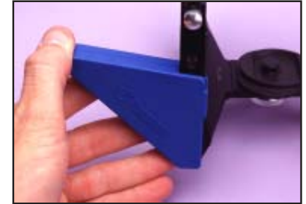
(2.) Girar la pata de apoyo hacia el gancho o unirlo al apoyo vertical del articulador.