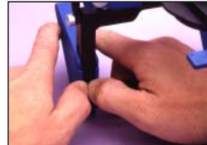
(3.) Colocar los pulgares en los ganchos de retención.