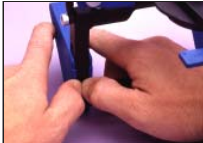
(3.) Colocar los pulgares en los ganchos de retención.