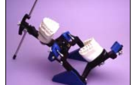
(6.) Abrir el bastidor superior para apoyarlo en el perno de apoyo para facilitar procedimientos de laboratorio.